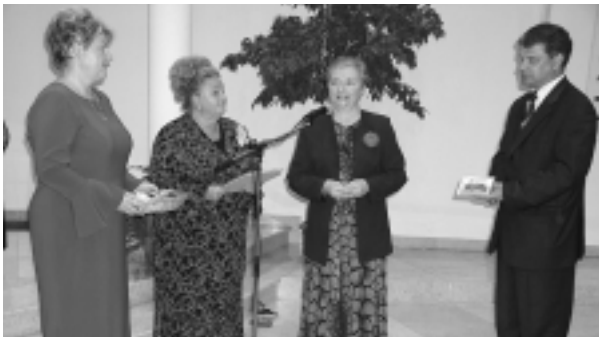
Uvedenie nového CD s piesňami detského speváckeho zboru Dúha.